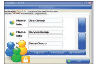
Benutzer- und Rechteverwaltung